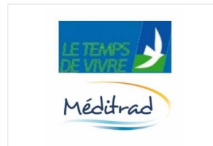
Auxigene (Le Temps de Vi...